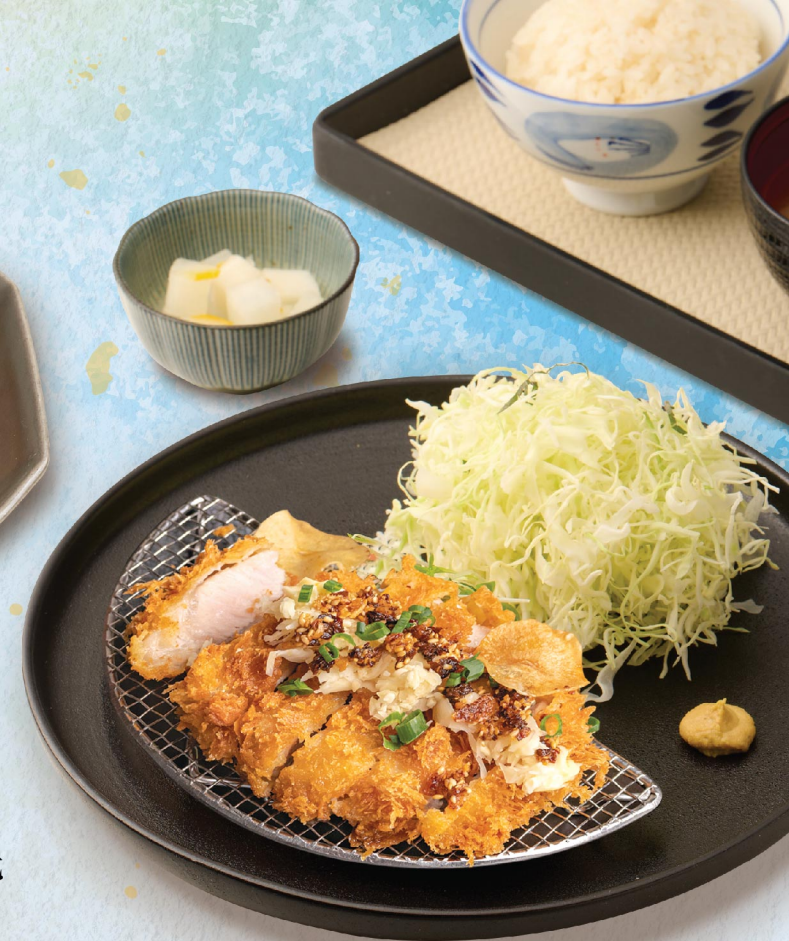
千歳豚のクリスピージンジャータルタル 北海道千歳豚生薑脆他他御膳 Hokkaido Chitose Pig Zen with Ginger Tartare Sauce 178元