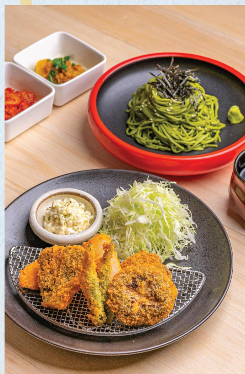
野菜カツ・冷茶そば 吉列野菜配冷緑茶蕎麥麵 Veggie Katsu with Cold Green Tea Soba Noodles