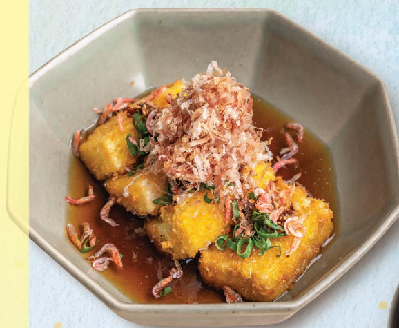
桜海老揚げ出し豆腐 櫻蝦日式炸豆腐 Japanese Style Fried Tofu with Sakura Shrimp 48元