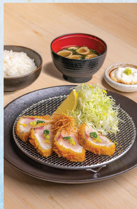
ハマチカツ・ゆず山芋ソース 吉列油甘魚柚子山芋御膳 Hamachi Katsu Zen with Yamaimo and Yuzu Sauce 138元