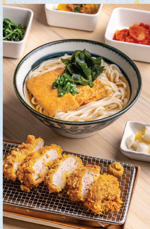
豚ヒレカツ・きつねうどん 吉列猪柳・昆布油揚げ豆腐烏冬 Pork Tenderloin Katsu with Kitsune Udon