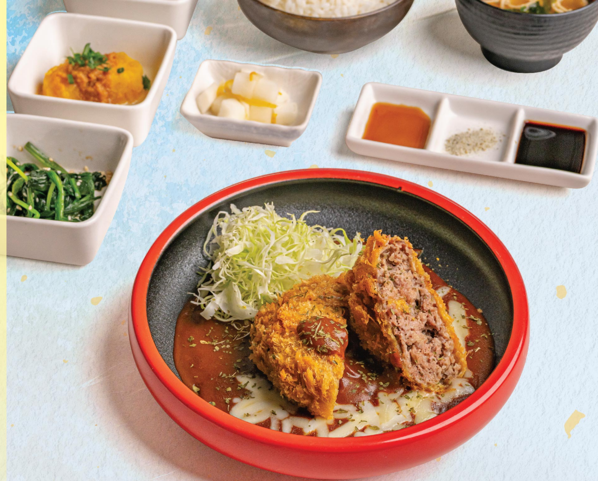
洋風ハンバーガーカツ御膳 洋風吉列牛漢堡御膳 Hamburger Steak Katsu Zen 128元